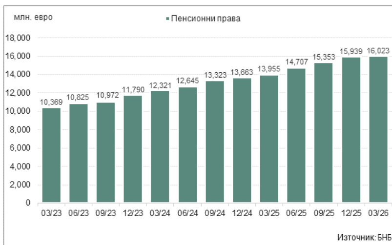
ГРАФИКА 3: ПЕНСИОННИ ПРАВА

В пасивите на пенсионните фондове в България преобладават пенсионните права , които възлизат на 16.023 млрд. евро към края на март 2026 година. Техният размер нараства с 2.068 млрд. евро (14.8%) в сравнение с края на март 2025 г. (13.955 млрд. евро) и с 84.5 млн. евро (0.5%) спрямо края на четвъртото тримесечие на 2025 г. (15.939 млрд. евро). Техният относителен дял в общия размер на пасивите към края на март 2026 г. е 99.6% при 99.5% в края на първото тримесечие на 2025 година.